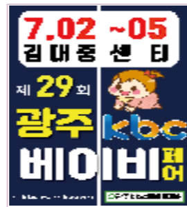
광주 전지역 200조 계첩