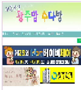
광주지역 최대맘카페 / 회원수 약 8만명