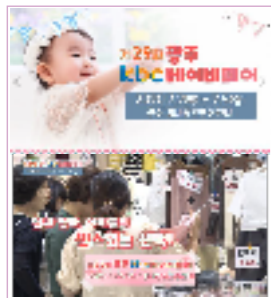
광주, 전남 약 350만명 시청 / 30일간 SA타임 송출