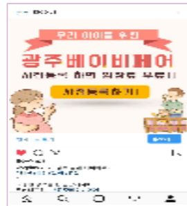
개최소식, 이벤트 공지