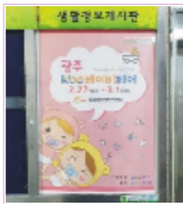
아파트 게시판 부착 / 병원, 돌잔치, 스튜디오 등 배포