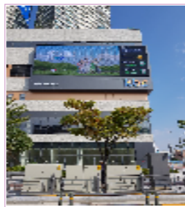
광주최대 유동인구 유스퀘어 맞은편 / 1일 약 120회 송출