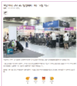
TV, 인터넷 뉴스 보도 / DB 약 20만개 보유