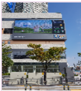
광주 최대 유동인구 유스퀘어 맞은편 / 1일 약 120회 송출