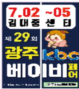
광주 전지역 200조 계첩