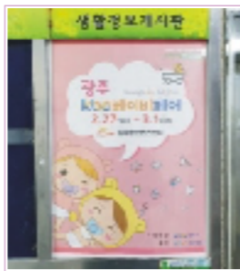
아파트 게시판 부착 / 병원, 돌잔치, 스튜디오 등 배포