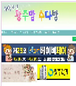
광주지역 최대맘카페 / 회원수 약 8만명