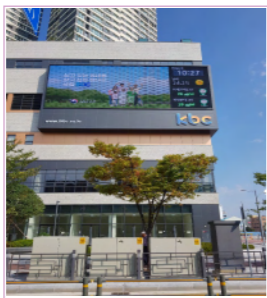
광주최대 유동인구 유스퀘어 맞은편 / 1일 약 120회 송출