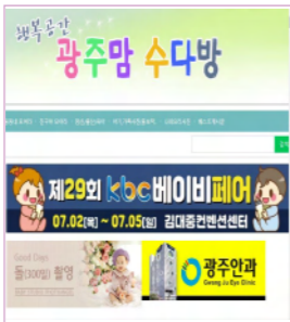
광주지역 최대맘카페 / 회원수 약 8만명