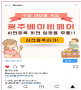
개최소식, 이벤트 공지