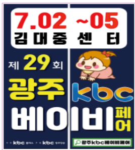
광주 전지역 200조 개척