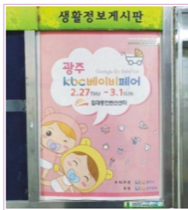
아파트 게시판 부착 / 병원, 돌잔치, 스튜디오 등 배포