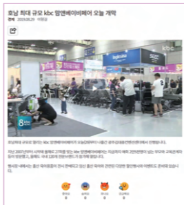
TV, 인터넷 뉴스 보도 / DB 약 20만개 보유