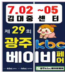
광주 전지역 200조 개척