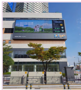
광주최대 유동인구 유스퀘어 맞은편 / 1일 약 120회 송출