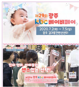
광주, 전남 약 350만명 시청 / 30일간 SA타임 송출