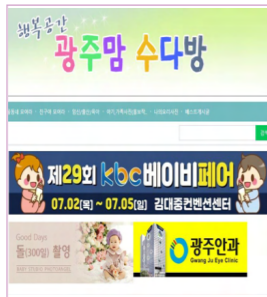
광주지역 최대맘카페 / 회원수 약 8만명