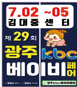
광주 전지역 200조 개첩