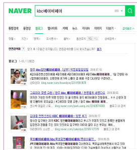
연관 검색 시 최상위 노출