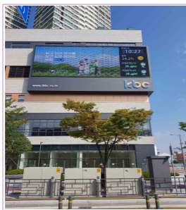
광주최대 유동인구 유스퀘어 맞은편 / 1일 약 120회 송출