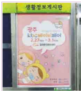
아파트 게시판 부착 / 병원, 돌잔치, 스튜디오 등 배포