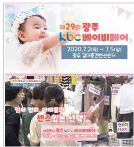
광주, 전남 약 350만명 시청 / 30일간 SA타임 송출