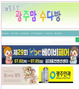
광주지역 최대맘카페 / 회원수 약 8만명