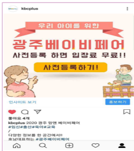
개최소식, 이벤트 공지